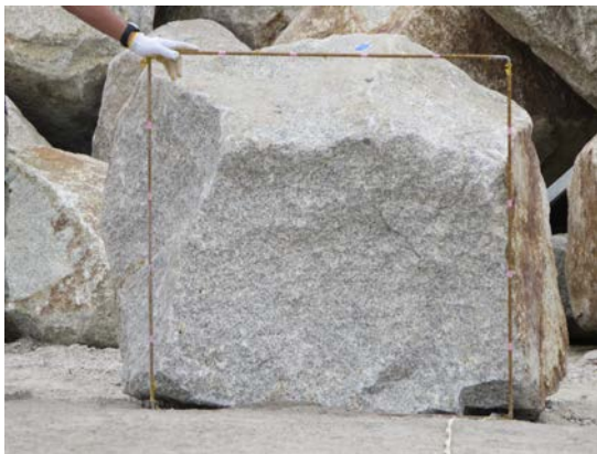
図1 1m 枠を置いて撮影した割石の側方投影画像の例。このような画像から側方投影面積を、画像解析ソフトウェア AreaQ(水研センター登録プログラム)を用いて画像解析する。

現在、日本工業規格 JIS には3軸の長さから割ぐり石の重量を推定する方法が示されているが、その推定誤差は非常に大きい。開発した方法は、信頼できる代替法として利用が期待される。